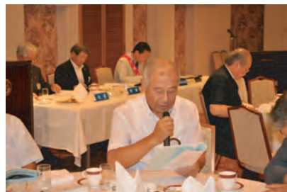
奉仕プロジェクト常任委員長