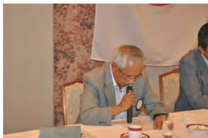
会員組織常任委員長

「各委員長から、本年度の活動方針が発表されました。詳しくは、クラブ概況報告をご覧ください。」