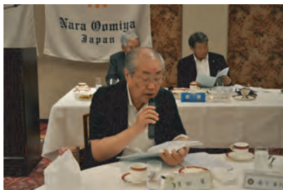
ロータリー情報委員長