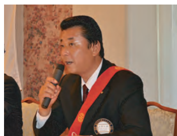
SAA・ソング副委員長