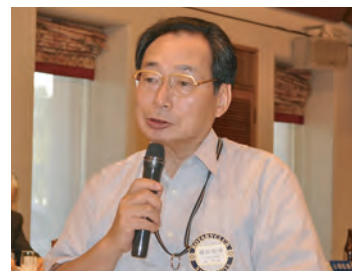
友好クラブ委員長