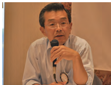
クラブ管理運営常任委員会