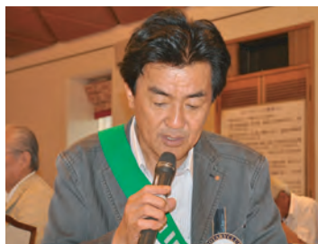
ニコニコ副委員長