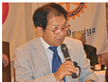
ロータリー財団常任委員長

「各委員長から、本年度の活動方針が発表されました。詳しくは、クラブ概況報告をご覧ください。」