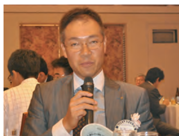
プログラム委員長