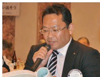
雑誌・広報委員長