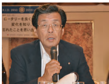
クラブ広報常任委員長