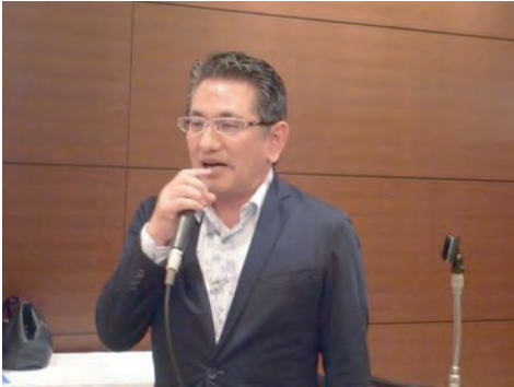
「野崎親睦活動委員長」