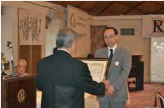
●ガバナー賞 ロータリー財団部門奉仕賞 (一人当たり $200達成)