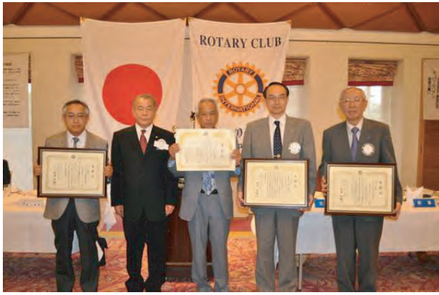
●新世代育成基金奨励賞 (奨励金：¥200,000)