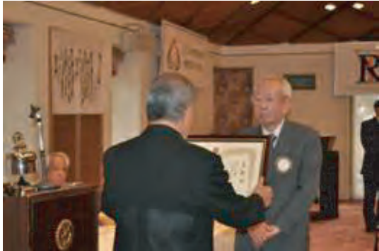
●ガバナー賞 奉仕プロジェクト部門 (奈良大宮地区防災訓練事業)