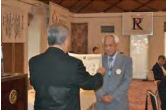
●ガバナー賞 米山奨学部門奉仕賞 (一人当たり ¥24,000達成)