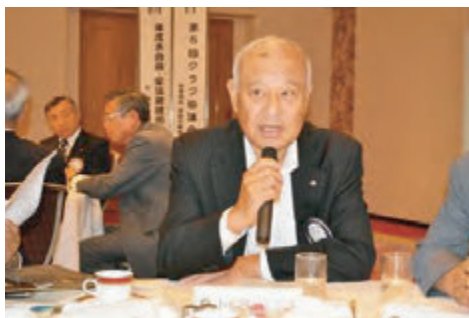
小西プログラム委員長