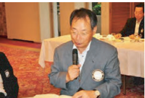
潮田友好クラブ委員長