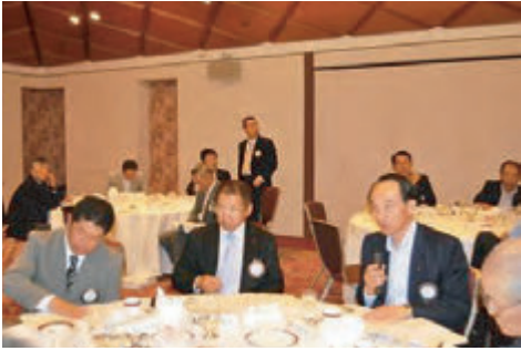
武藤職業奉仕委員長 武中新世代委員長 西口国際奉仕委員長