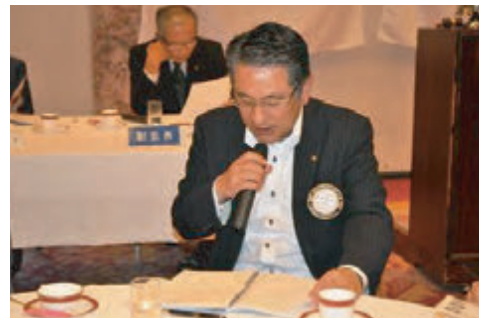
野崎親睦活動委員長