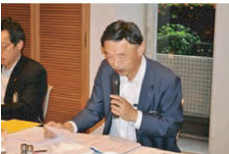
楠原会員組織常任委員長

本年度の締めくくりとして、各委員会より、活動報告が行われました。詳細については「年間報告」をご覧ください。