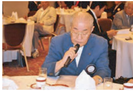
多田ロータリー情報委員長 クラブ研修リーダー