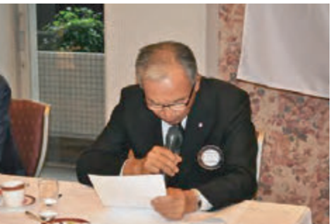
北神クラブ管理運営常任委員長