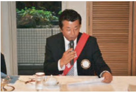
宮西会場監督・ソング委員長