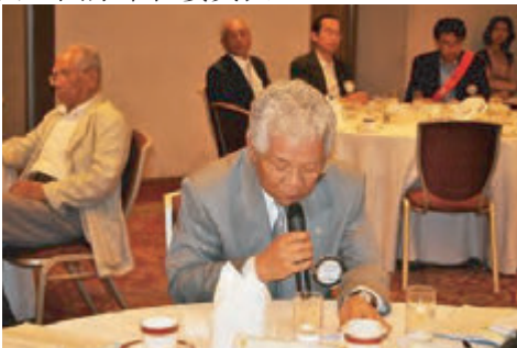
矢追クラブ広報常任委員長