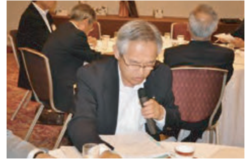
佐川ロータリー財団常任委員長