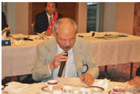
楠下会員選考委員長