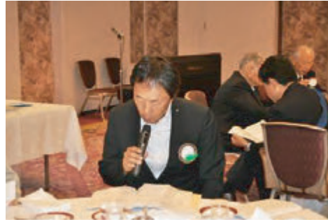
西口国際奉仕委員長