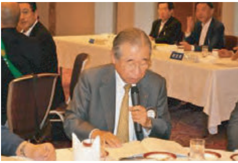
高木職業分類委員長