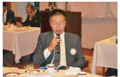
高野会員増強委員長