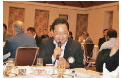
平方会報・IT委員長