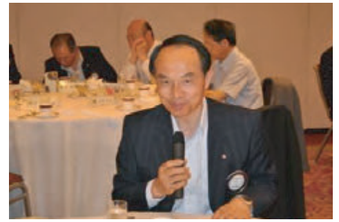
多田奉仕プロジェクト常任委員長 社会奉仕委員長