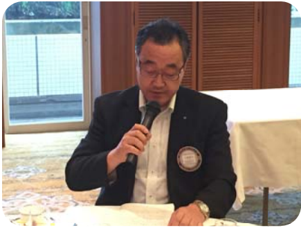
プログラム委員会 弓場委員長