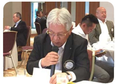
職業分類委員会 矢追委員長