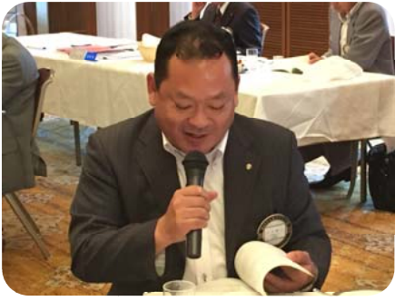
職業奉仕委員会 平方委員長