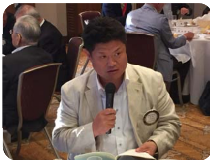
会員増強委員会 中奥委員長