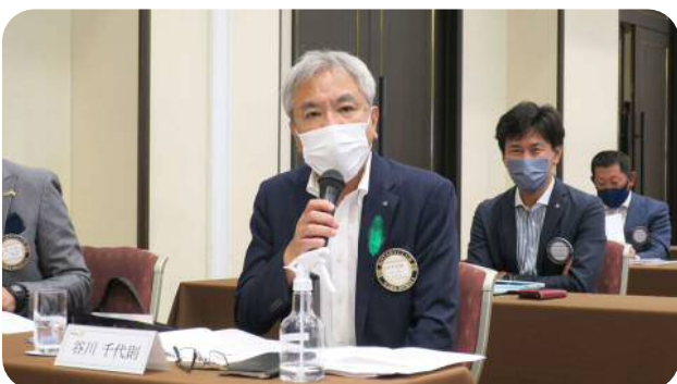
【谷川委員長】 (プログラム委員会)