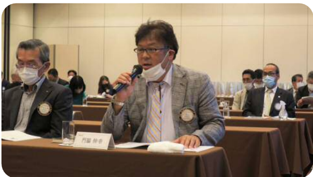
【門協委員長】 (国際奉仕委員会)