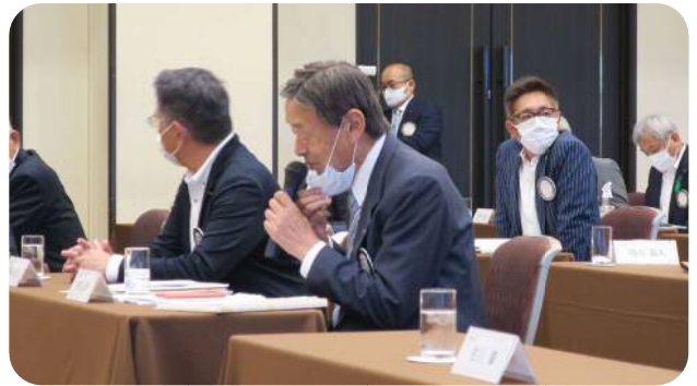
【楠原委員長】 (職業分類委員会)