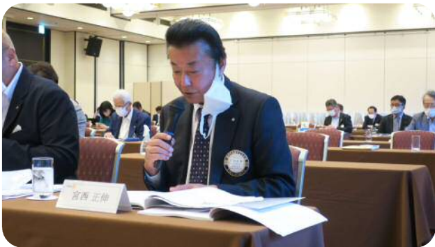
【宮西委員長】 (職業奉仕委員会)