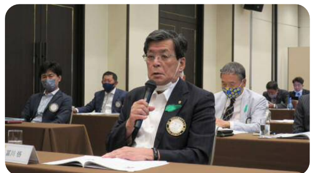
【富川委員長】 (出席委員会)