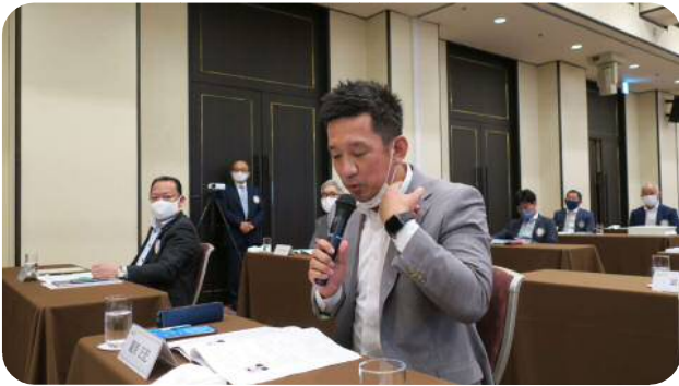
【國原委員長】 (会報・雑誌委員会)