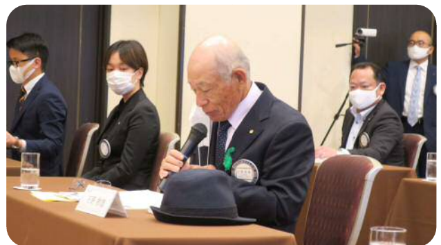
【石野委員長】 (会員選考委員会)