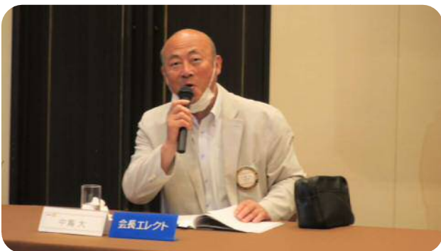
【中寫委員長】 (会員組織常任委員会)