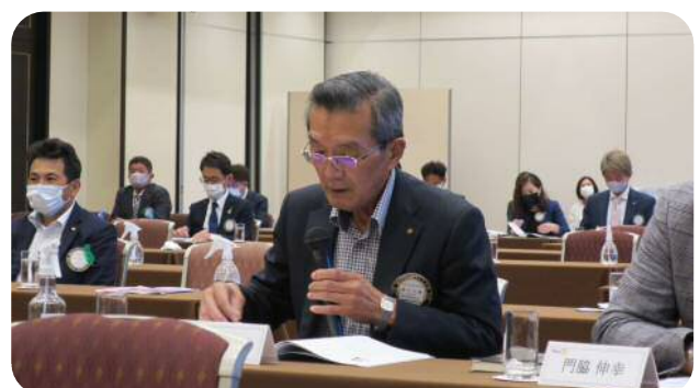
【藤井委員長】 (ロータリー財団委員会)