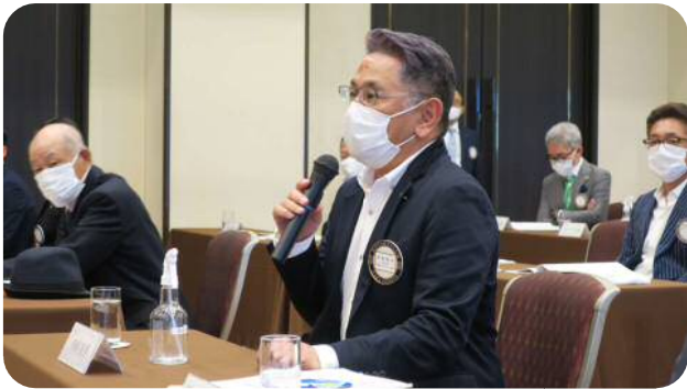
【野崎委員長】 (会員増強委員会)