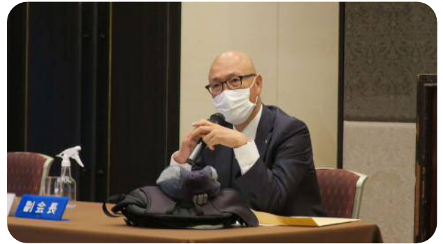
【高野委員長】 (クラブ管理運営常任委員会)