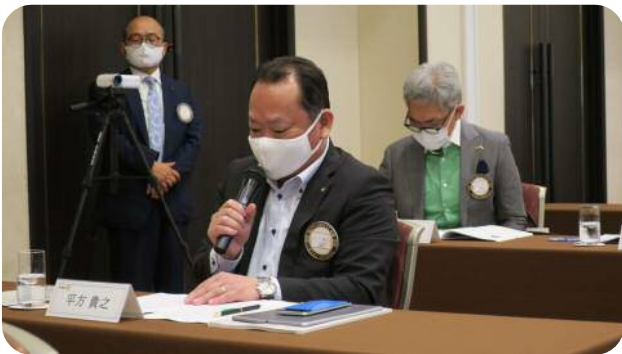
【平方委員長】 (ニコニコ委員会)