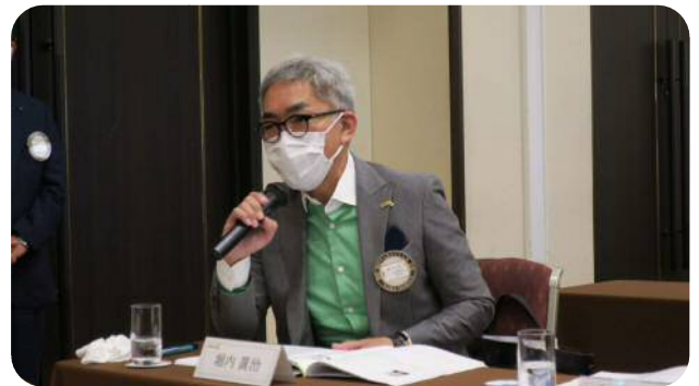
【堀内委員長】 (親睦活動委員会)