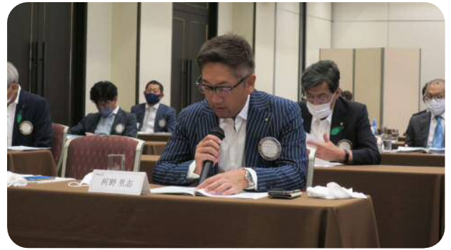
【河野委員長】 (広報・IT委員会)