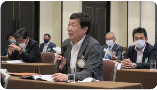
【増井委員長】 (クラブ広報常任委員会)